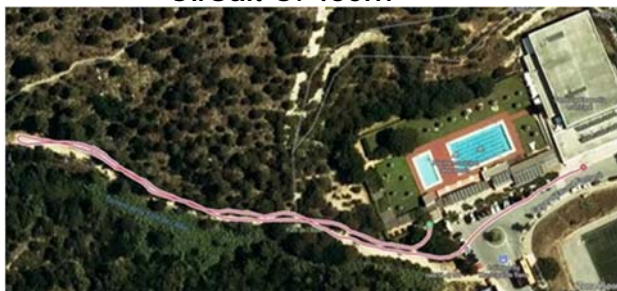
Circuit C: 450m