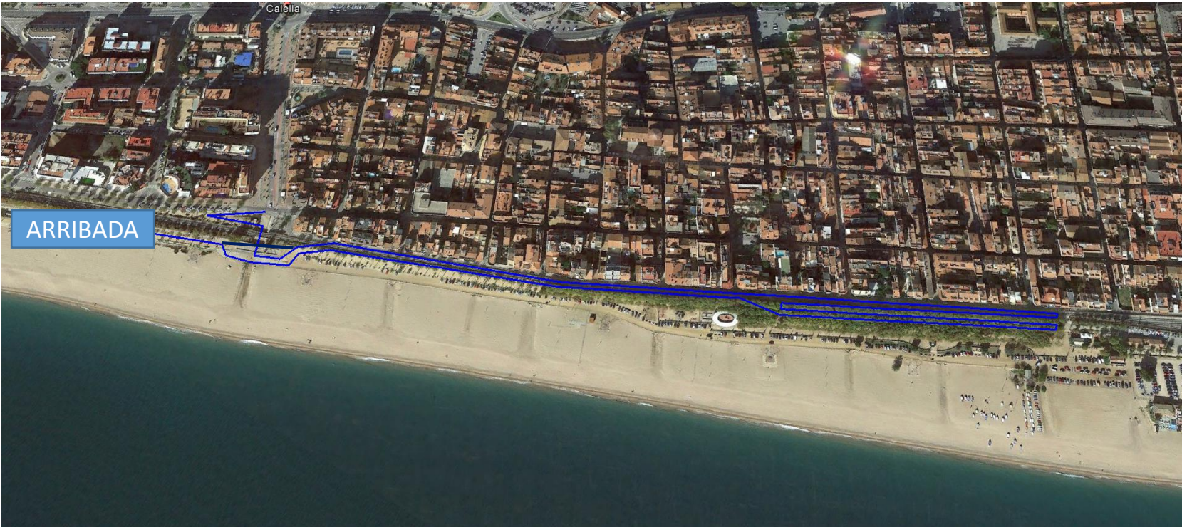
CAT Circuit de córrer passant des de Riera de Capaspre cap el Passeig Marítim pel Passeig Manuel Puigvert fent 2 voltes girant en el Pont de Fusta i en la segona volta finalitzant en l'arribada en el passeig Marítim de la Platja de Garbí